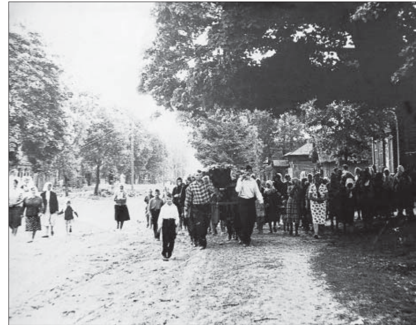
Похороны на улице Святска, 1970-е гг.

Именно расселение, четко разделившее жизнь на до и после аварии, служит точкой отсчета практически во всех современных расска-