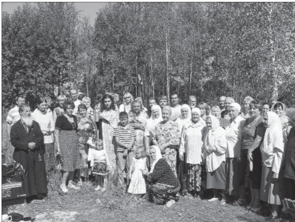
Святские жители после молебна. 2011 г.

солнышко, и гляжу на церкву. А церкви то уже нету! А там вот такой вот крест! Блескучий. И вот как солнышко встает, так той крест играет. А я сама себе: «А церковь то нема, а церковь то нема!» И я проснулась. И вот пришла в церкву и говорю: «Знаешь, отец Сергей! — и Володька там Жук. — А все равно надо над церквой хоть крест поставить, коло алтаря. Все же, — я говорю, — вон там есть. Он, — говорю, — блеснуть, но он нам не показывается. Он, — говорю, — там есть». Отец Сергей и Володька говорят: «Ну что ж, надо нам, наверно, крест поставить». И Колька Калюпанов, он милиционером в Гомеле, и Володька приехали, и они, наверно, три дня тут жили. И делали этой крест. И этот крест поставили. И начали ездить. Молебен служат теперь.