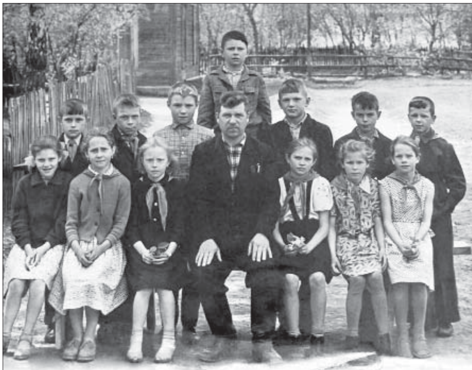
Святская школа. 1980-е гг.