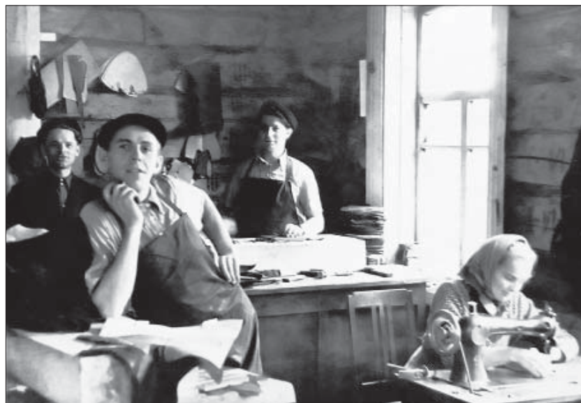
Святская швейная мастерская. 1970-е гг.

Ой! Намучилися мы, всяго нагляделися! По лесу ходили из села. Уже ш немцы тут от-ко, идут палить ету деревню. Все идуть и палять, идут и палять! А наш же дом, большой же, красивый, тут и церковь близенько. Мы уж глядим, сидим у болоте — церковь будеть гореть, и мы погорим. А той край, другой, горить усё. А до нас еще не доходить. А одна старушка, соседка, рядышком с нами жила, осталась: «А я никуда не пойду, хоть и сгорю, а дома». Мы же, уже как самолеты немецкие летять: «Борона лятить, борона лятить», — и мы все хоронимся. У нас на городе, в саду был окоп. И мы в той окоп у