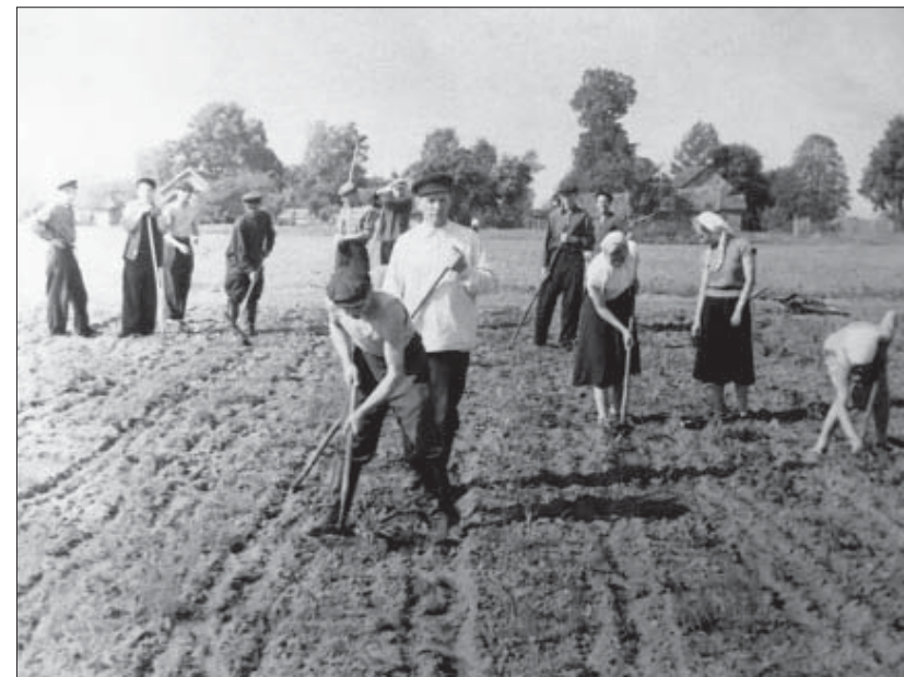
Работа в колхозе. 1970-е гг.

Факторами, снижающими социально-психологическую и культурную дистанцию между старообрядцами и евреями, служили, как социальное аутсайдерство по религиозному признаку (и старообрядцы, и иудеи относились к преследуемым конфессиям в дореволюционной России), так и ограничение основной сферы реализации определенным типом связанных между собой занятий (ремесло и торговля). Собственно, само соседство старообрядцы объясняли экономическими причинами: «У старообрядцев много было купцов. А где купцы, там и евреи» или «Старообрядцы то они ремесленники в основном. А там где ремесло, там и деньги есть. А там где деньги, там еврей должен торговать» и т.д. (записано от И.А. Кузнецова, 1945 г.р.). При этом отношения друг с другом информанты характеризуют как