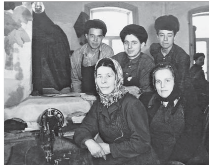
Святская швейная мастерская. 1970-е гг.

Характерное для старообрядчества использование эсхатологических категорий в интерпретации реальности, когда все окружающие явления — бытовые новшества, природные катаклизмы и техногенные катастрофы — трактуются как приметы последних времен, описанные в «старинных книгах», вопреки ожиданиям, оказались не востребованными в рассказах о Чернобыле, которому не предшествовали ни обычные накануне значимых событий предчувствия, ни вещие сны: «Вот ничего не говорило, ничего! Хоть верь, хоть не. И не снилося, и